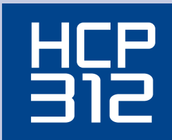
Side load case packer Encaisseuse horizontale

• Vertical carton magazine, easy to load with cases laid flat.